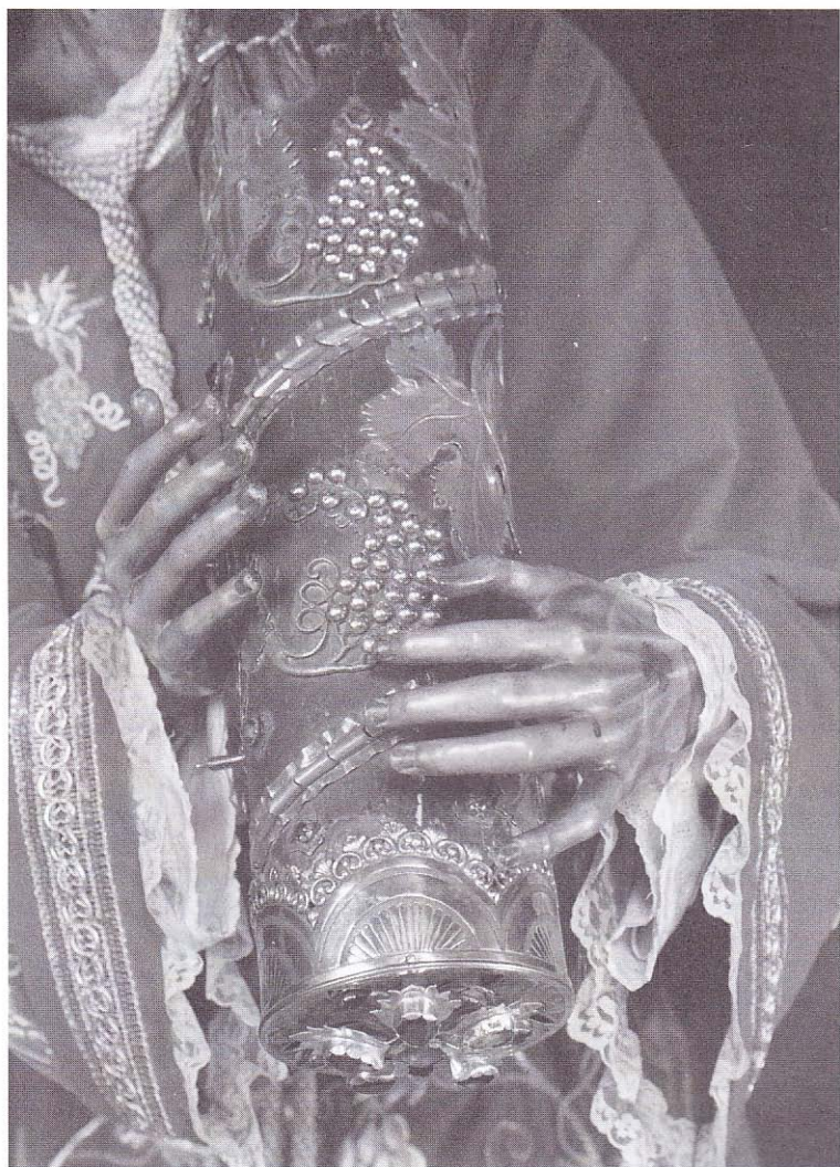
Las manos de Jesús de la Merced, Patrón Jurado de la Ciudad