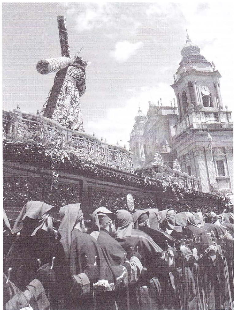
Viernes Santo del 2008. Acercándose a Catedral al medio día, Jesús de La Merced llega al encuentro con sus devotos