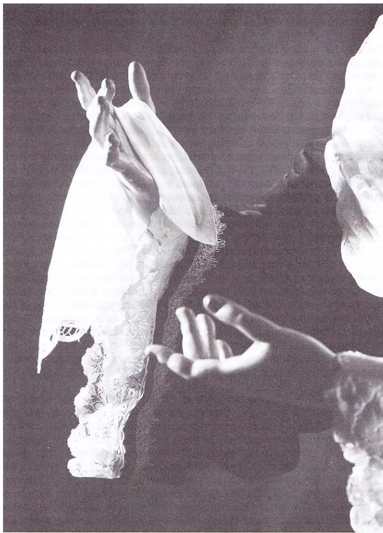
Las manos de la Dolorosa de La Merced