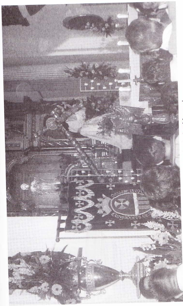
Velación de Jesús de La Merced. Domingo 6 de Agosto del 2006. 289 años de su Consagración