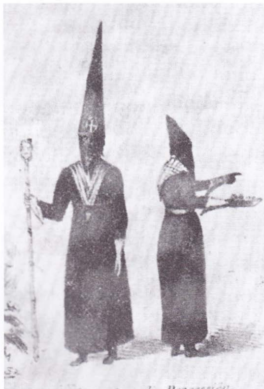
Cucuruchos con trajes usados aún a finales del Siglo XIX.

Son también claras las amenazas del entorno humano actual: secularismo difundido por los medios de comunicación, consumismo, sectas, otras religiones, desarraigo de los orígenes y masificación urbana que generan un cambio cultural.