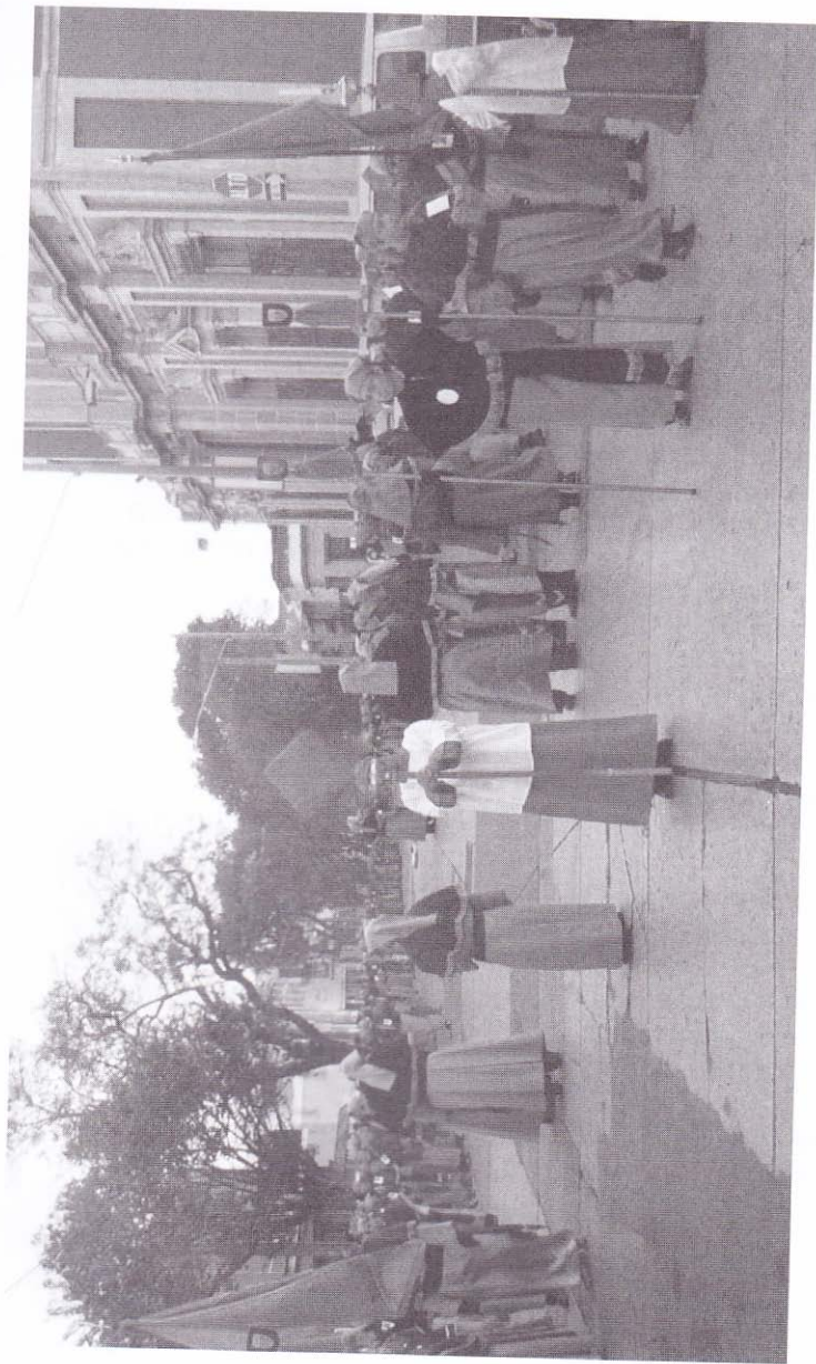
Viernes Santo del 2006. La cruz y los ciriales abren la procesión de La Merced, pasando por la 6a. Avenida, Zona 2.