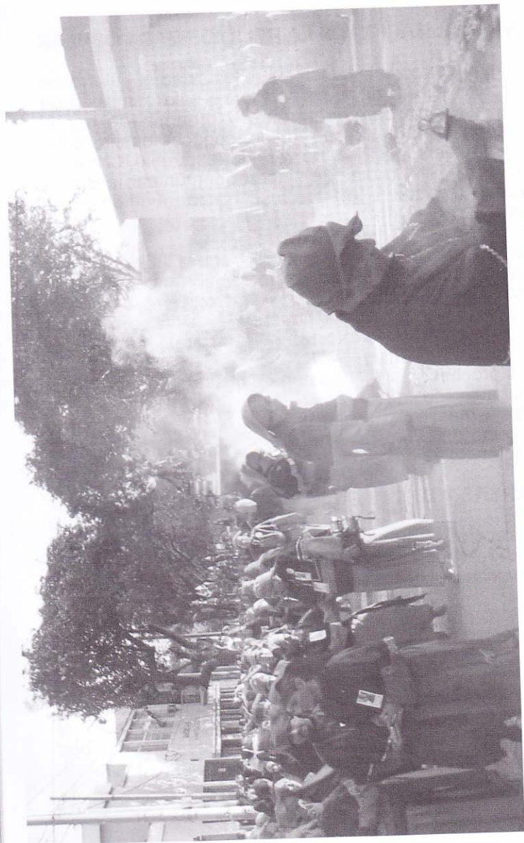
El incienso: rito, religiosidad y aroma de Viernes Santo.