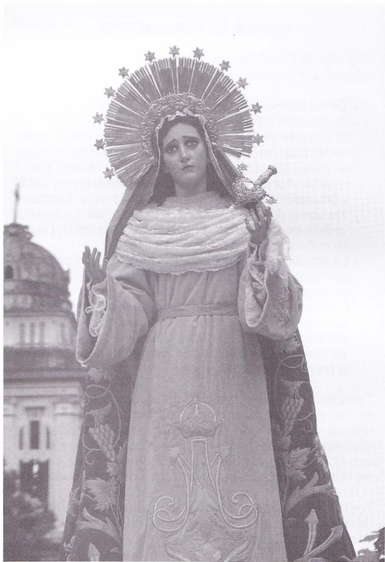
Santísima Virgen de Dolores. Iglesia La Merced. Guatemala.