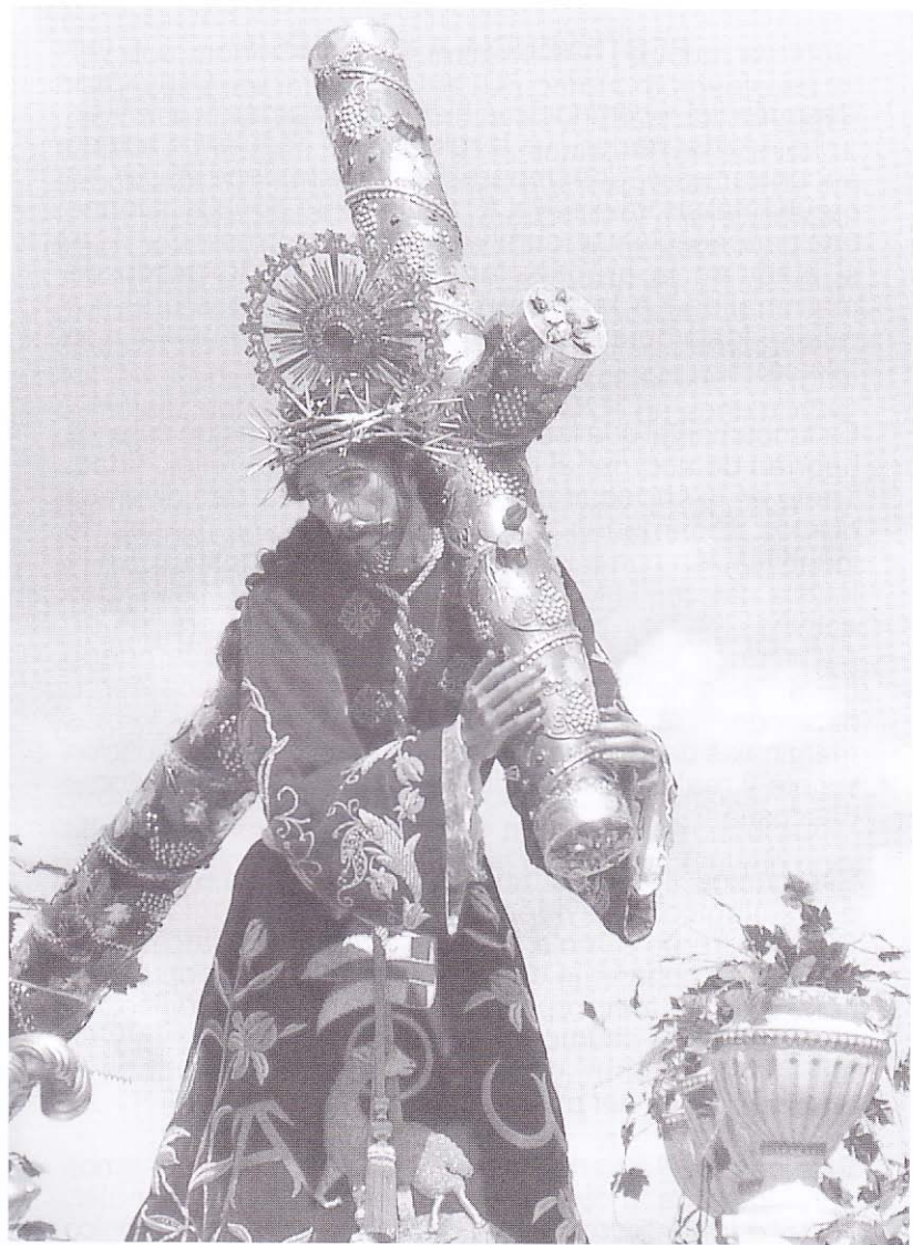
Consagrada imagen de Jesús Nazareno de La Merced. Guatemala.