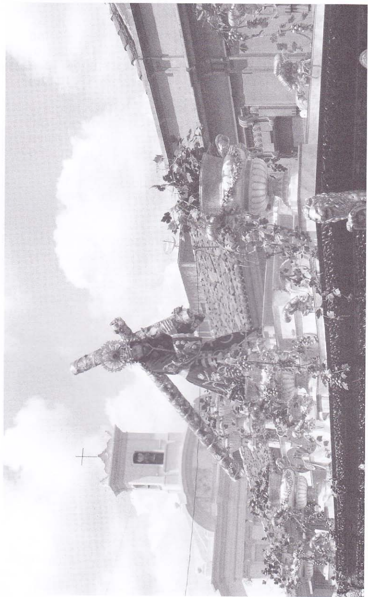
Viernes Santo 14 de Abril 2006.