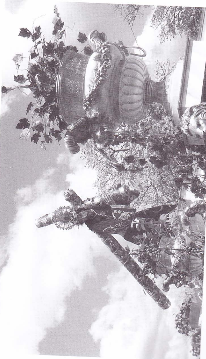
"Yo soy la vid, ustedes los sarmientos". Jn. 15, 5 Alegoría de las andas de Jesús de la Merced . Viernes Santo, 14 de abril del 2006.