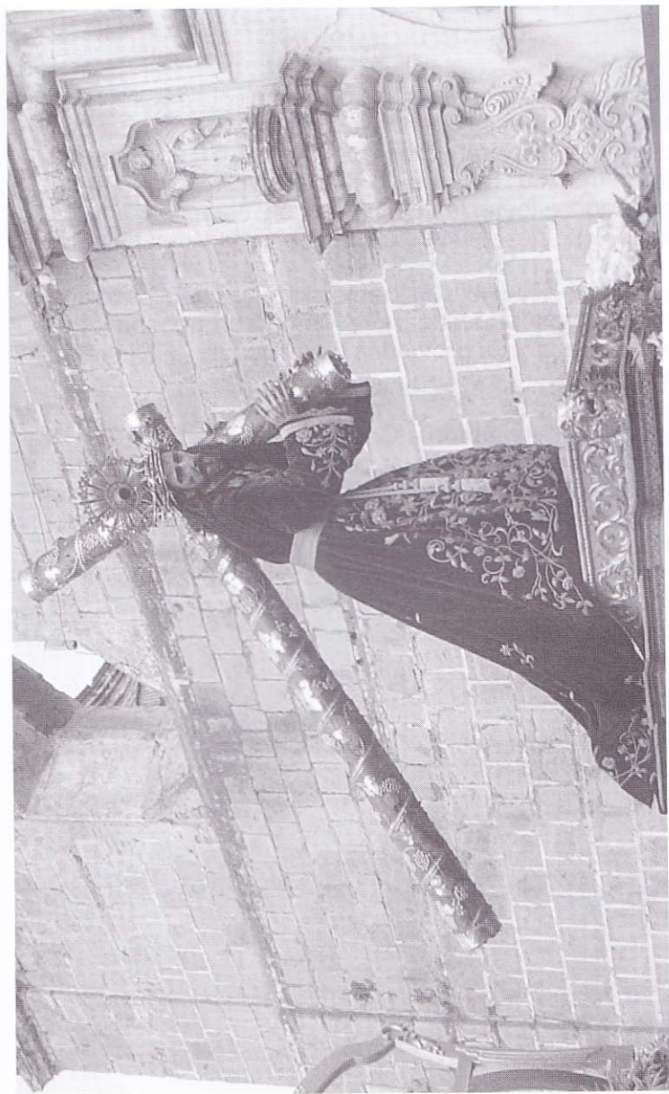
Visita de Jesús Nazareno de La Merced de Guatemala a la Ciudad de Antigua. 26 de Febrero del 2005