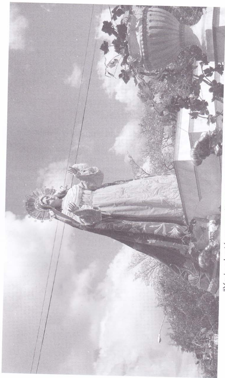
"Yo te planté como viña mía, escogida y hermosa" Santísima Virgen de Dolores de la Merced. Viernes Santo 14 de Abril del 2006.