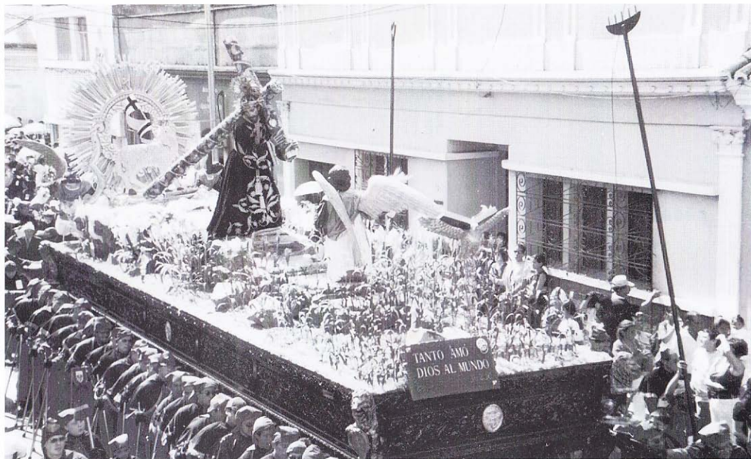
Viernes Santo 18 de Abril del 2003 "Tanto Amó Dios al Mundo" Jn. 3:16