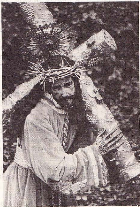
Consagrada Imagen de Jesús Nazareno de la Merced