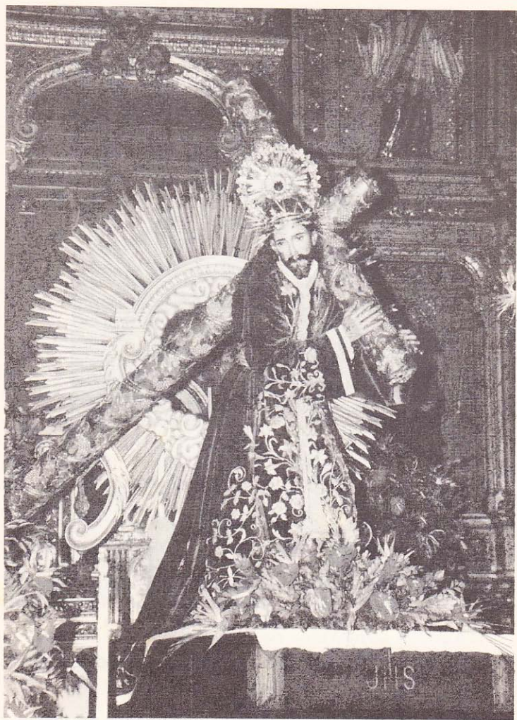
Velación de la Consagrada Imagen de Jesús Nazareno de la Merced. Domingo 3 de Agosto del 2003.