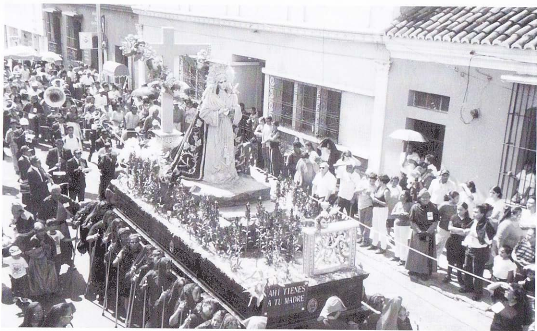
Viernes Santo 18 de Abril del 2003 "Ahi Tienes a tu Madre" Jn. 19:27