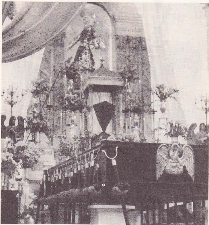
Antiguo Altar Mayor de la Iglesia de la Merced. Nótese a la Consagrada Imagen Jesús Nazareno.