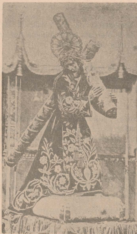
Consagrada y Milagrosa Imagen de JESUS NAZARENO DE LA MERCED